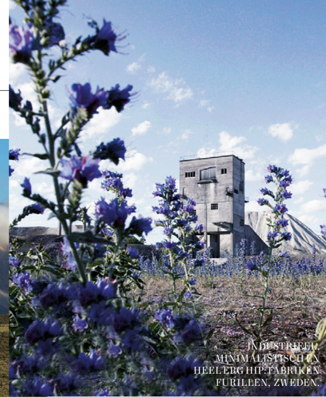
INDUSTRIËEL, MINIMALISTISCH EN HEEL ERG HIP: FABRIKEN FURILLEN, ZWEDEN.